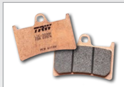
SV/SH SINTER STREET