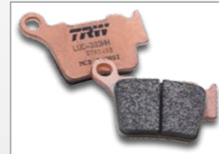
RSI SINTER OFFROAD

RACING BRAKE PADS PLAQUETTES DE FREIN RACING