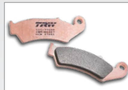
SI SINTER OFFROAD